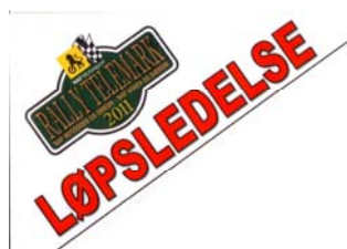
Funksjonærmerke plassert H side frontrute.

Vakt skal ikke forlate stedet før arrangør gir beskjed.